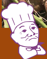
ケーキ職人 中山 久良蔵