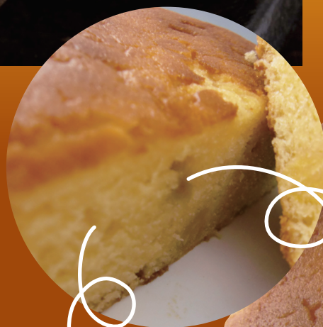
ダイスカットした皮ナシの安納芋を 贅沢に散りばめました。

〒533-0031 大阪市東淀川区西淡路2-11-60 TEL.06-6324-8705 FAX.06-6324-8700 http://pureflour.jimdo.com/